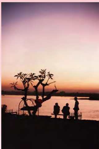
(メコン川の夕暮れ)