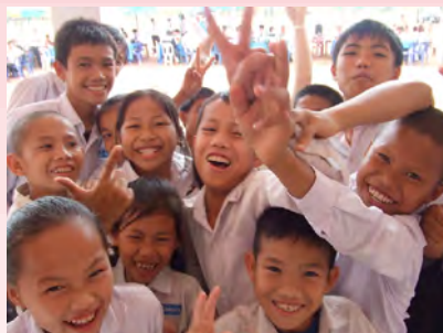
(ラオスの子どもたち)